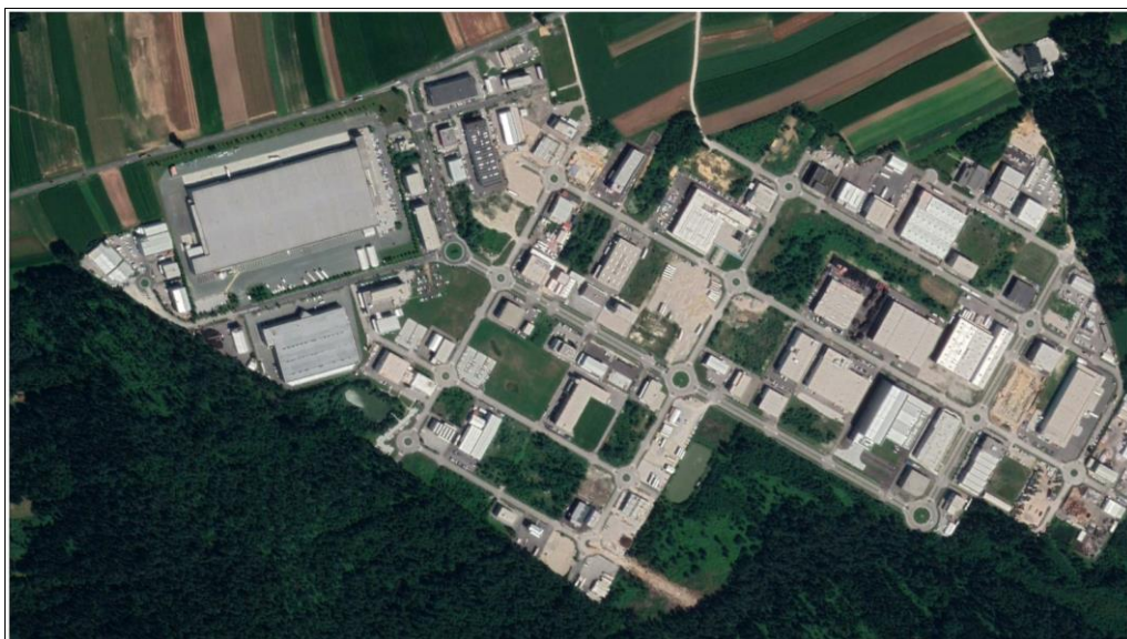
Cona iz zraka

Na voljo so tudi parkirišča v južnem delu cone in sicer v parkirni hiši IMP PUMPS.