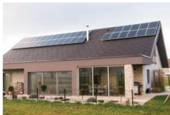
Sončna elektrarne GEN-I na stanovanjski hiši

lastno uporabo do izvedbe in zadovoljstva ob prvih kWh elektrike, proizvedenih na domači strehi, tako enostanovanjske hiše kot večstanovanjske stavbe, kmetije ali poslovnega objekta.