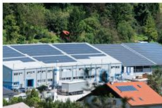
Sončna elektrarna GEN-I na poslovni stavbi

Sončna elektrarna GEN-I Sonce vam takoj zniža stroške za elektriko, osebno zadovoljstvo pa vam bo prinesla tudi njena okoljska korist, saj pretvorba sončne energije v elektriko ne povzroča izpustov CO 2 , glavnega krivca podnebnih sprememb, ki se same od sebe najverjetneje ne bodo ustavile. A pri GEN-I so prepričani: pregovor »Zrno na zrno pogača ...« drži tudi pri ukrepanju proti podnebnim spremembam.