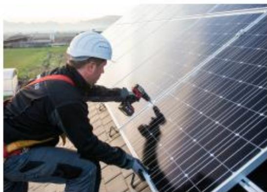
Montaža sončne elektrarne GEN-I

V GEN-I Sonce kupcem že več let omogočajo različne sheme ugodnega financiranja, ki jih prilagodijo željam kupca: takojšnje enkratno plačilo, kratkoročno 7-letno brezobrestno odplačilo in do 15-letno potrošniško kreditiranje , ki vam ga zagotovi ponudnik sam.